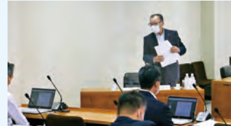
(委員会質問の様子)