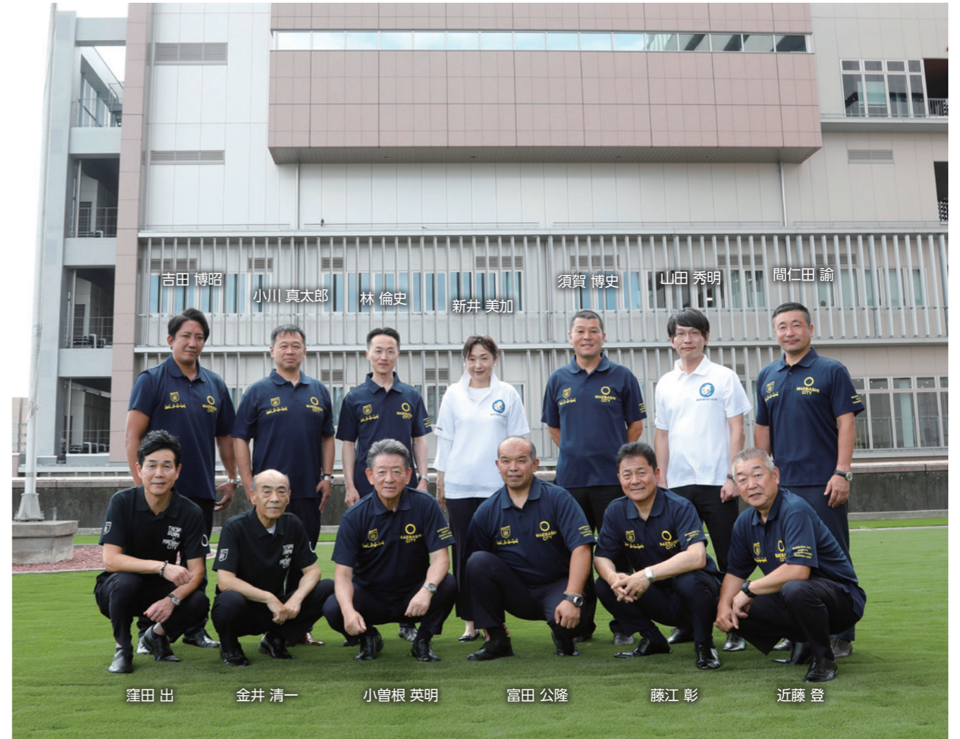
(前橋市役所 3階庭園より議会庁舎をのぞんで)

昌賢学園まえばしホール（前橋市民文化会館）2階 入館料：無料 ※詳細は市ホームページよりご覧ください