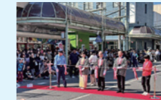
前橋まつりオープニングセレモニー

令和6年3月臨時会、5月第1回定例会、7月第2回、9月第3回、12月第4回と令和6年は本会議が5回（延べ開催日数99日間）開催され、本会議に於いて各派代表質問及び総括質問が行われ活発な議論が交わされました。全議員が地域の代表であり、加えて市民の代表として尽力しております。私も全議員と同様に、市民の福祉向上・安全安心なまちづくり・ライフライン確保・更には本市発展の為に全議員と力を合わせ、邁進してまいります。