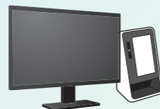
① タッチで手続きを選択

各種手続きの申請書を記入する負担を軽減するため、マイナンバーや免許書などから氏名や住所を読み取って申請書を作成する「書かない窓口」を実施しています。