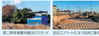
第二野球場審判棟及びスタンド 波志江スマートICまで延伸工事中