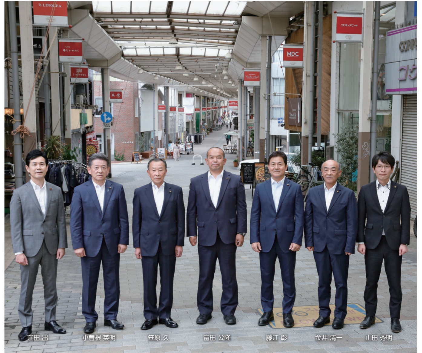
(前橋中央通り商店街にて)